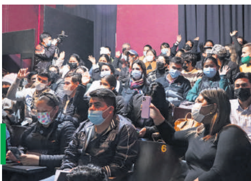
Estudiantes universitarios asistentes al evento