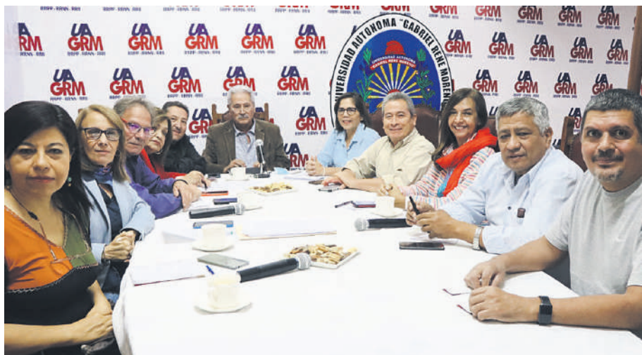
Miembros del OPN en el conversatorio virtual sobre los 40 años de la recuperación de la democracia