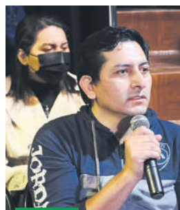
El público asistente aportó con sus comentarios