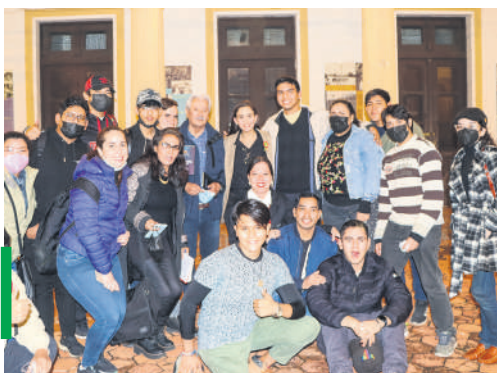
Alta asistencia de público al evento