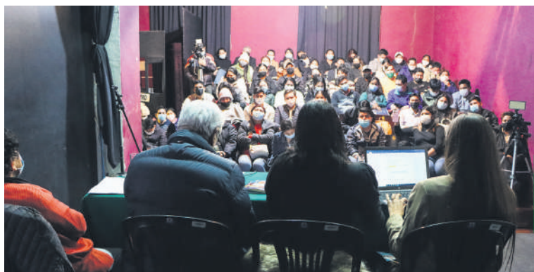
Panelistas y público asistente al foro sobre la Ley 348